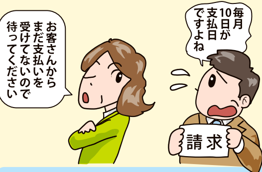
下請代金の支払遅延