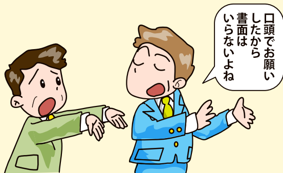
発注書面の不交付