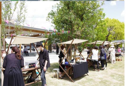
導入イメージ (物販施設 (マルシェ))