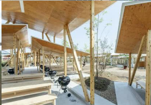
導入イメージ (バーベキューエリア)