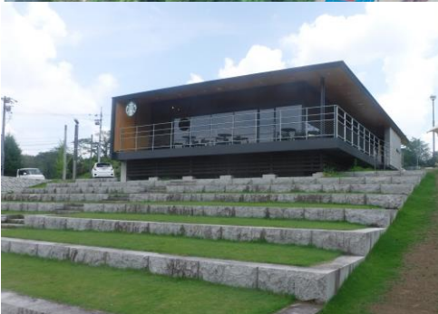
導入イメージ (カフェ)