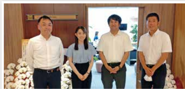
加古川観光協会のスタッフ 「私たちが加古川のこと、ご紹介します」

全国各地、そして海外からのお客様をお迎えするこのホテルで、加古川の魅力を最大限にPRし、また地元の方には新たな加古川の魅力を発見していただける場にしたいと思っています。加古川の銘菓やかつめしのたれも販売していますので、お土産でもご自宅用でもご利用いただけます。