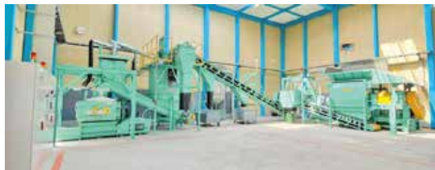
RPF事業部（神崎郡市川町）の破碎・成形処理設備

これにより、ビジネス課題であった廃棄物の削減と有効利用が進むと同時に、SDGsの目標達成にもつながる形となっています。