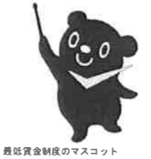
最低賃金制度のマスコット チェックマン 特技：みんなの最低賃金の確認