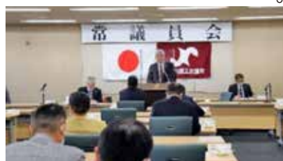
新体制で3年間協力します

続いて審議事項に移り、顧問・相談役・参与の委嘱案、委員会正副委員長及び委員の委嘱等の人事案件について審議が行われ、提案どおり承認決定されました。終了後、昨年に引き続き「加古川BUY応援キャンペーン」を実施する案内を行いました。12月20日には第180回臨時議員総会を開催、常議員会の議題を全て報告事項として説明を行いました。