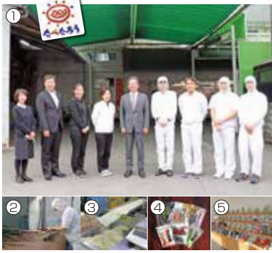
今月の表紙 『前島食品㈱』