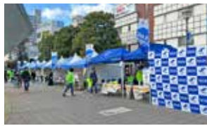
様々なブースが並びます

11月27日、青年部主催で「地域活性化フェスティバル」を加古川駅南広場にて開催しました。