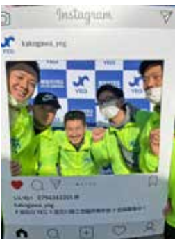
インスタグラムも是非ご覧ください kakogawa_yeg