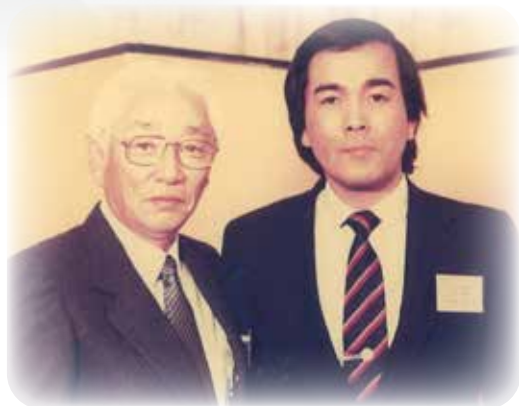
ソニー創業者 盛田昭夫氏(左)とともに

住 所: 加古川市上荘町都染515-2 T E L: 079-428-2708 営業内容: 電気・空調・住宅設備機器 家電・LPガス・リフォーム