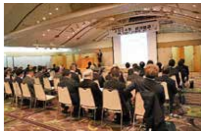
大勢の参加者で埋まる会場

海外経済の動向、日本経済の動向、兵庫県の短観のポイント、管内金融経済概況のポイントについてそれぞれ話がありました。