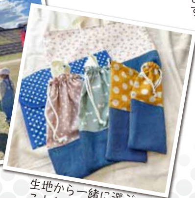
生地から一緒に選ぶこともできます