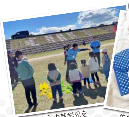
0歳から未就学児をお預かりしています

の起業サポートとしてインスタグラム運用コンサルト業もしています。ハンドメイドは誰に向けた商品なのか大切で、SNSの発信は誰に向けた発信なのかターゲットを明確にすることが大切という共通点があります。運用を始める方、うまくいかない方の手助けになればと試行錯誤しています。その中で、春から女子野球チームのSNSを代行する機会を頂き、今後はスポーツチームと託児所を提携し、スポーツ選手のお子様のお預かりもできたら、と考えています」と力強く将来を見据えます。