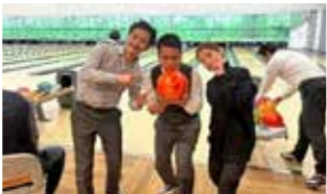
ボウリングで交流を深めました

懇親会はニッケパークボウルに会場を移し、久しぶりのボウリングを楽しみ想像以上に盛り上がり、メンバー同士交流を深めました。景品にメンバー企業のクワッソサンたい焼き、ふりかけと海苔のセット、いちごのタルト、チーズケーキ、靴下など豪華賞品を用意、順位発表時には大いに盛り上がり、メンバー企業の紹介にもなりました。