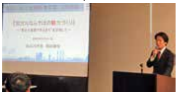
岡田市長と意見交換

この例会の目的を「産官学で意見交換を行い、多様で柔軟な発想を引き出すために、加古川交流研究会や地域交流フェスティバルで得た知識と経験を共有する事で、加古川を持続可能な未来へ繋ぐ事」とし、岡田市長、野北県民局長、市職員、兵庫大学生、カコリバースの方々にもご参加頂きました。