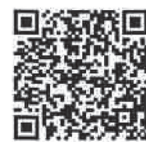
国税局LINE 公式アカウント

【問い合わせ先】加古川税務署 法人課税第1部門 TEL079-421-2968(源泉所得税担当)