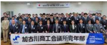
加古川商工会議所青年部 次年度もよりよい活動が出来る様邁進します

最後に、大阪府で唯一の粗大ごみ処理設備で破砕される過程と、鉄やアルミ等への選別過程を見学し、最後に積極的な質疑応答が飛び交いました。参加者は9名