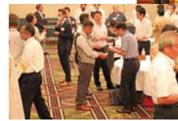
名刺交換で交流を広げる