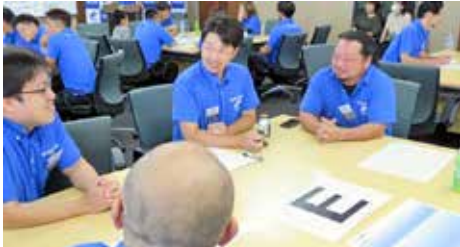
テーブルディスカッションでは子ども達からも積極的な意見が出されました

『Just For Someone』今年度スロークガンの「誰かのために」を基に、未来委員会は、子供たちが希望を持って生きる明るい未来づくりを目指し、今年度12月例会で『子供の夢を叶え隊2023』事業を開催する予定です。そのために、地域の小学校6年生に『加古川を大好きなまちになるために』と題して夢の募集を行いました。