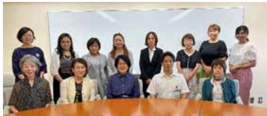
加古川ならではの幸せが実感できるまちを目指して

8月10日、 更なる加古川 の発展のため に岡田市長と の懇談会を開 催しました。