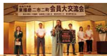
ステージ上でのPR！ 気になる企業ばかり！