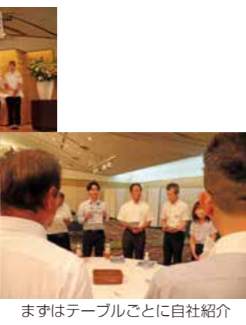
まずはテーブルごとに自社紹介