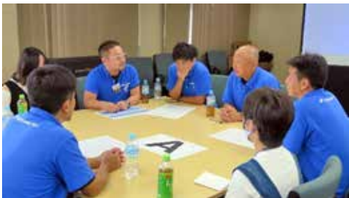
夢の実現に向けて案を練っています