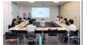
国内で唯一「ラノリン」を生産していると学ぶ

参加者からは「普段なら絶対入ることができない研究室や製造現場を見学させてもらい、貴重な経験になった。化粧品の原料に興味があり参加しましたが、数えきれない種類の原料があり、身近な商品に使われていることが知れておもしろかった」との声が聞かれました。