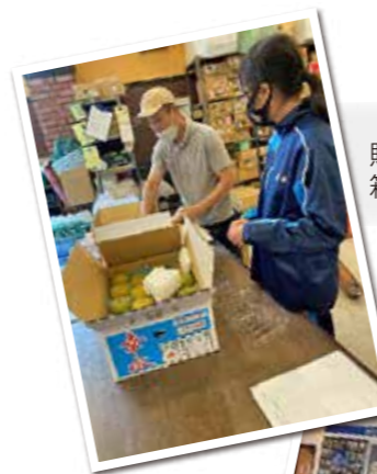
贈答品用果物を自分で箱詰め体験