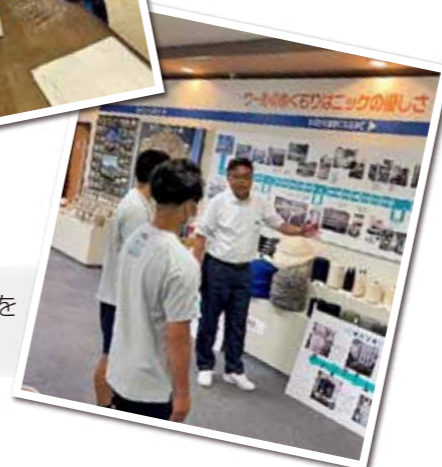
生地生産工程を見本から学ぶ