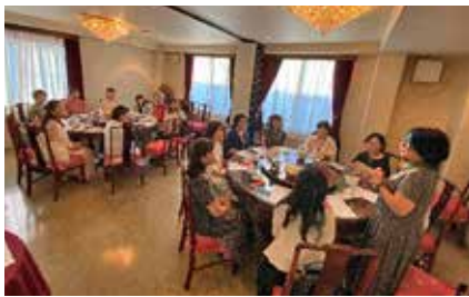
中華料理を堪能しながら時間を忘れ歓談

普段あまりおしゃべりをした事のないメンバーとも親睦が深まり、とても楽しく笑顔の絶えない納涼懇親会となりました。