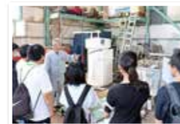
工場での機械の説明を熱心に聞く参加者