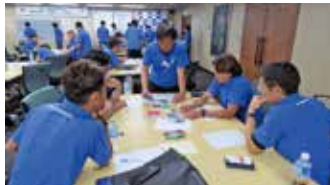
チームに分かれてゲームを実施