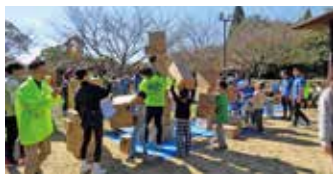
メンバーの新たな一面も発見

昔あそびでは、オリジナルめんこ作り、巨大とんとん相撲など、今の時代あまりすることのない遊びをし、子供達とメンバーの笑顔がたくさん生まれました。BQではメンバー間、家族間で良い交流が生まれ、貴重な時間を過ごすことができました。