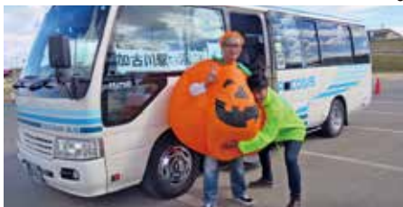
無料シャトルバスで実証実験

今回は河川敷で行われたカコリバースのイベントと同日開催しました。「東播磨地域づくり活動応援事業」の補助金を活用し、実証実験として加古川駅と河川敷を繋ぐ無料シャトルバスを運行し、市内はもちろん、市外からも来場があり、「シャトルバスがあることで両イベントに参加できて良かった」「これからも運行してほしい」と嬉しい言葉も頂きました。