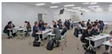
グループディスカッションで大盛り上がり