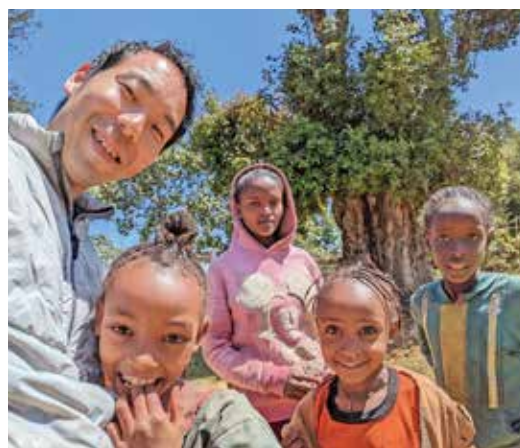
寄付活動を通じたエチオピアの子どもたちとの交流

調べるうちに1つ考えついたのが、ダイレクトトレードという方法でした。生産者と直接取引を行うことで、公正な価格で彼らのコーヒー豆を購入し、持続可能な農業を支援することができると。ですが、商社でもない個人のコーヒー屋がダイレクトトレードするのは非常に難しく、高いリスクが伴います。諦めきれずに輸入方法を模索する中、元商社の個人輸入者や同じ豆を扱う海外ロースターの力を借りて、