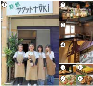
今月の表紙 『寺家町酒場 季/サクトTOKI』