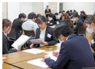
ロールプレイングを行う受講生

2日目は、実践的な練習を主に行い、電話対応や名刺交換等を同じ班のメンバー同士で練習しました。学生時代とは異なる敬語表現や、名刺交換までの一連の流れなど、初めての経験に奮闘する様子が見られました。