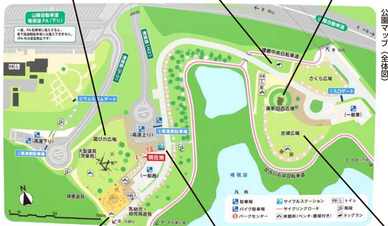
公園マップ（全体図）