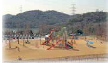
権現湖PAからの眺望

加古川市が再整備を進めていた権現総合公園が3月30日にオープンしました。園内には子供向けの大型遊具やミニドッグラン、サイクリングを楽しむ方向けのサイクルステーション等があります。また、山陽自動車道の権現湖パーキングエリア（PA）とも連結しており、アクセスも良好です。開園時間は8時30分から17時30分まで（高速道路側駐車場は9時から17時まで）