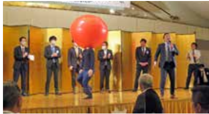
頭に風船をかぶり盛り上がりました

様々な方法で紹介しました。記者会見風に職務を紹介する委員会やお笑い芸人のネタで盛り上げる委員会、体を張って組体操や瓦割りを披露する委員会も。我ら総務研修委員会は、委員長の思いが詰まった赤いボールを繋いでいき、最後には委員長自らが赤い巨大風船に入るといった紹介をしました。残念ながら成功