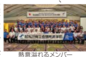
熱意溢れるメンバー

今回の決起会では、かがわ大会に向けての意気込みを共有し、全体の士気を高めることができました。特に、各メンバーからの熱意溢れる発言や、活発な意見交換は非常に有意義であり、かがわ大会成功に向けての大きな一歩となりました。