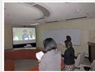
全国大会で全国の経営者と交流がはかれます。今年オンラインで開催されました。

会員入会資格：商工会議所会員事業所の女性経営者ならびにその役員、などの女性 お問い合わせ：加古川商工会議所 指導課（女性会事務局 TEL 079-424-3355）