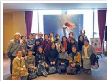
今年はいけませんでした、毎年バス旅行で親交を深めています。

会員相互の交流が困難な現在も、つながり、励まし、元気をもらえる仲間がいる事は何よりも力になります。変化する時代に向かい、一緒に新しい道を探して進んで行きましょう！